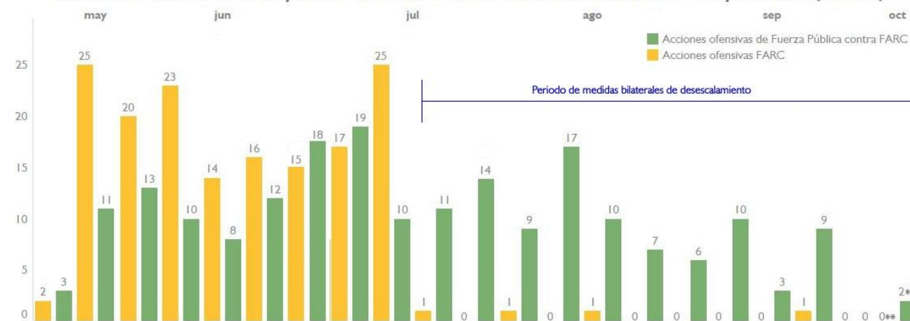
Acciones ofensivas de las FARC y acciones ofensivas de la Fuerza Pública contra las FARC may - oct 2015 (semanal)