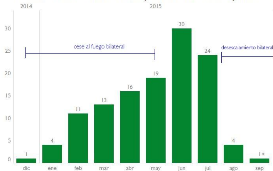
Combates entre la Fuerza Pública y las FARC dic 2014 - sep 2015

Fuente: Base de Datos del Conflicto Armado en Colombia - CERAC Fecha de consulta: 19 de septiembre de 2015. Datos provisionales, sujetos a revisiones continuas, incorporación de nueva información y actualización de la información existente. * Datos del mes de septiembre al día 19